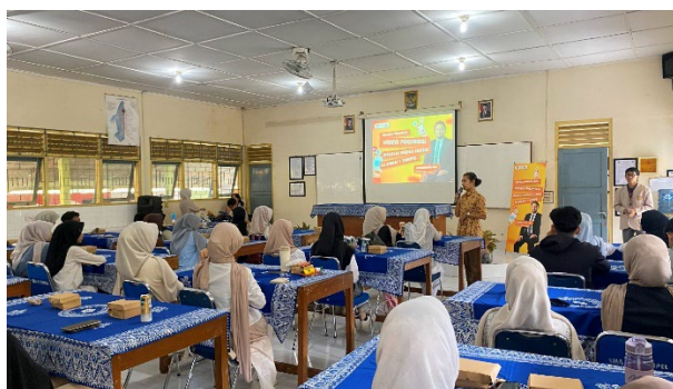
Gambar 1. Kegiatan pelaksanaan pengabdian yang diikuti 44 peserta.

Dalam pemaparan materi tersebut, peserta mendapatkan pemahaman, bahwa " Content is King, but Marketing is Queen ," yang artinya visual yang menarik perhatian audiens dan membuat konten lebih mudah diingat, sehingga meningkatkan kemungkinan konten untuk dibagikan. Sedangkan membawa pesan yang kuat dan relevan dalam cerita akan meningkatkan koneksi emosional dengan audiens, mendorong audiens untuk terlibat lebih dalam dengan konten. Pemahaman lain yang membuat peserta antusias, yakni mengenai tiga pilar konten reels untuk promosi. Ketiga pilar tersebut adalah; (1) pilar pendidikan, bahwa konten edukatif menarik perhatian dan pengetahuan; (2) Hiburan, yakni video yang menghibur dapat menarik lebih banyak viewers ; (3) Pilar konten inspiratif, bahwa konten inspiratif dapat mendorong penonton untuk beraksi.