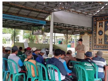
Figure 1 Siklus Metode PAR

Kegiatan ini diikuti oleh 25 peserta yang merupakan pekerja dengan aktivitas fisik harian. Pelaksanaan kegiatan dilakukan melalui beberapa tahapan sebagai berikut: